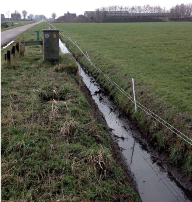
Het anti-vossenraster heeft twee laaggespannen draden die onder stroom gezet worden.

We zijn dit jaar gestart met het plaatsen van rasters op drie bedrijven die vorig seizoen veel last hadden van vossen. Een raster bestaat uit twee draden die onder stroom staan en op een hoogte van ongeveer 15 cm en 30 cm boven maaiveld worden gespannen rondom de huiskavels van het bedrijf.