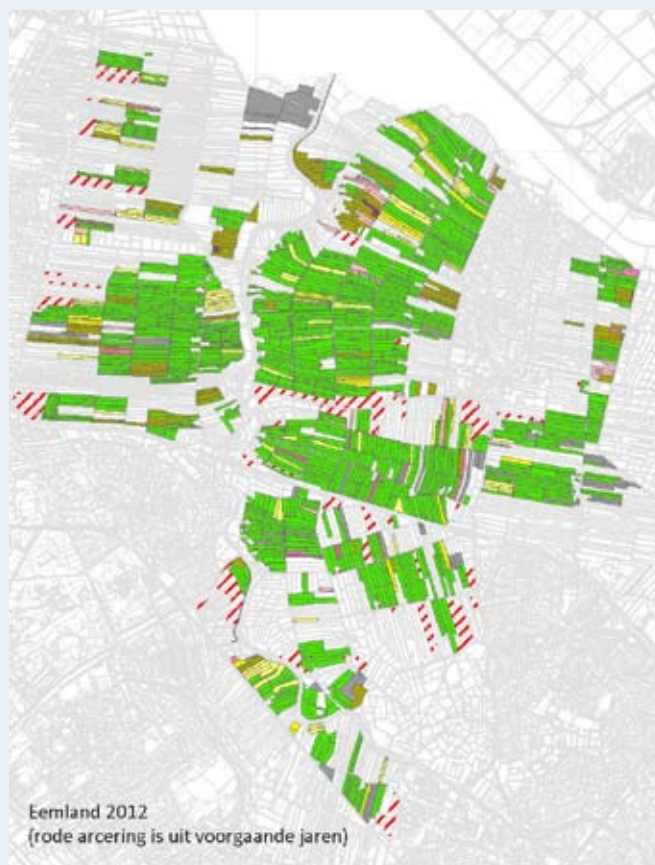
Figuur 1 - Overzicht van het SNL-beheer in 2012

De opdrachtgever voor het beheerplan, de provincie Utrecht, let steeds kritischer op de kwaliteit van het beheerplan. We zullen de komende jaren steeds opnieuw moeten streven naar kwaliteitsverbetering. Delen waar geen of te weinig weidvogels voorkomen zullen moeten afvallen. Zelfs voor 2012 hebben wij – d.w.z. het Gebiedscoördinatieteam Eemland – al opdracht gekregen een aantal delen uit het plan te halen. De totale oppervlakte met SNL-beheer in 2012 is dan ook minder dan in 2011. In gebieden met betrekkelijk weinig vogels en relatief veel verstoring zijn verscheidene eenheden uit het plan gehaald. Dat zijn onder andere zones langs de rijksweg A1, de Wakkerendijk, de Meentweg en langs de Bisschopsweg. Een overzicht van het beheer in 2012 is te zien in Figuur 1. De beheereenheden die in het kader van de kwaliteitsimpuls voor 2012 moesten worden verwijderd uit het plan liggen in de rood gearceerde gebieden.