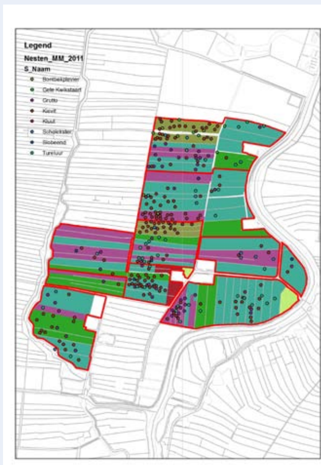
Figuur 3 - Territoria in Reservaat Eemland 2011 (Niet volledig, alleen de soorten die ook voor het agrarisch deel van de Maatpolder is getoond).