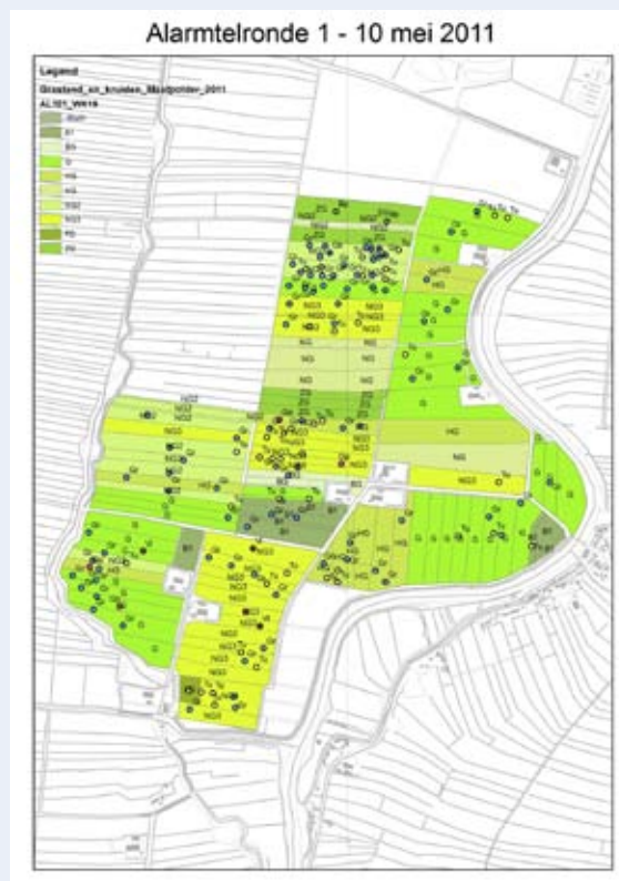
Figuur 4 - Spreiding van alarmerende weidevogelgezinnen bij de eerste ronde.

Een voorbeeld van de spreiding van de alarmerende weidevogelparen is te zien in Figuur 4.