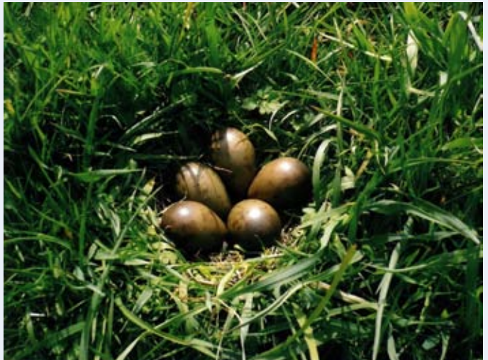
Foto 1 - Soms liggen er meer dan vier eieren in een nest. Deze foto is genomen in de Maatpolder. Misschien willen ook de Grutto's daar zelf af wat extra's doen voor de instandhouding van de populatie?

De aantallen weidevogels zijn van jaar tot jaar verschillend, maar toch kan worden gezegd dat het noordelijk deel van Eemland en met name het reservaat en de Maatpolder zeer belangrijk zijn voor weidevogel en met name ook voor de Grutto.